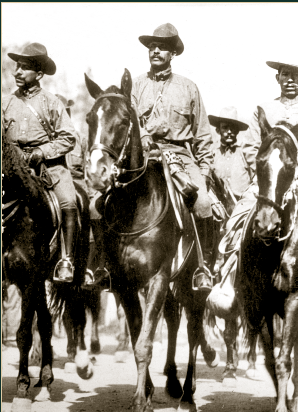
Felipe Ángeles y otros militares a caballo. 6 de diciembre de 1914.

© (287496) SECRETARÍA DE CULTURA, INAH, SINAFO, FN, MX.