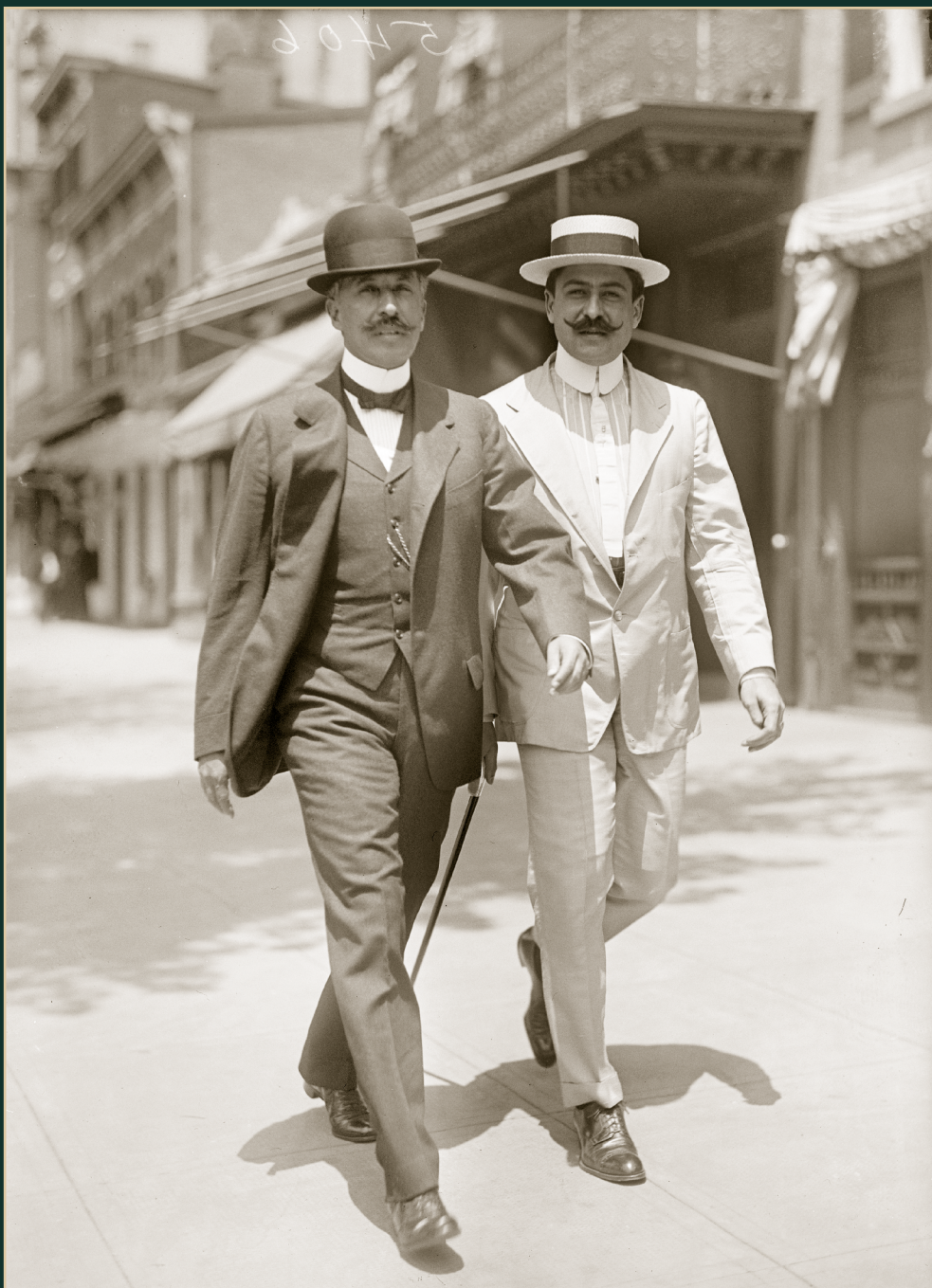
El general Felipe Ángeles en el exilio. 1917.