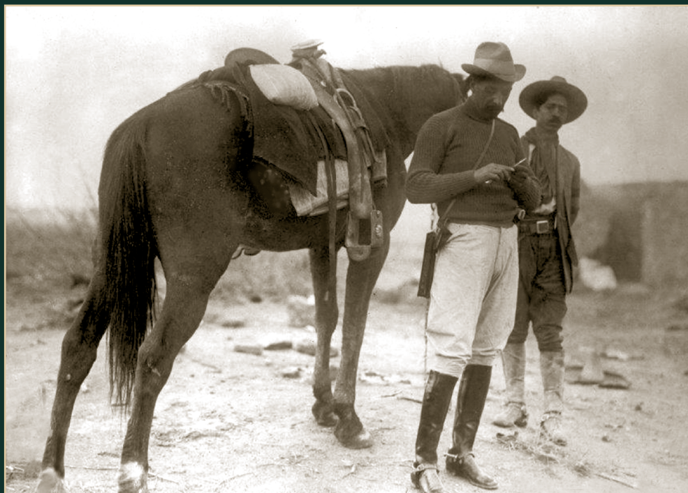
El general Felipe Ángeles en los alrededores de Monterrey, Ca. 1915. Biblioteca del Congreso de Estados Unidos.