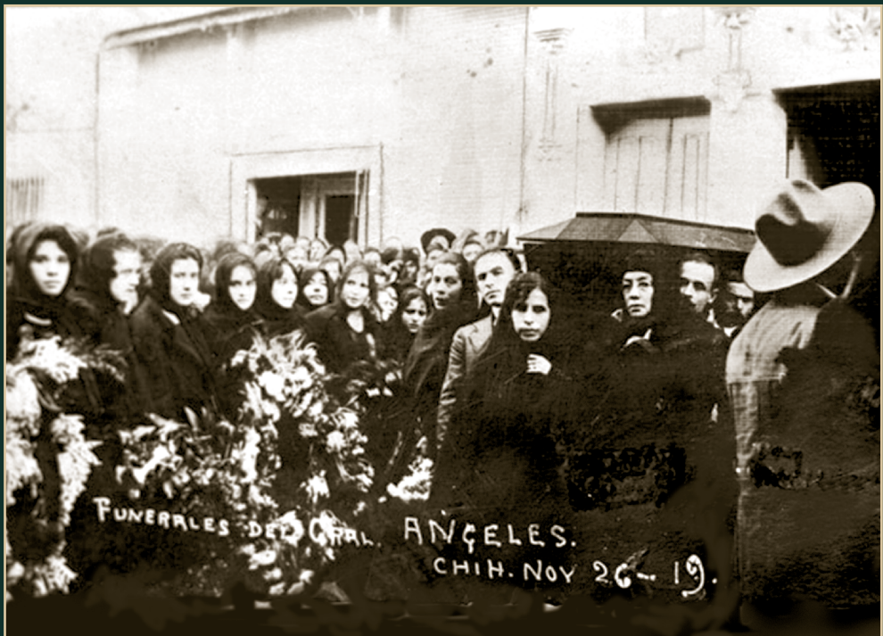
Funerales del general Felipe Ángeles. Chihuahua, 26 de noviembre de 1919.