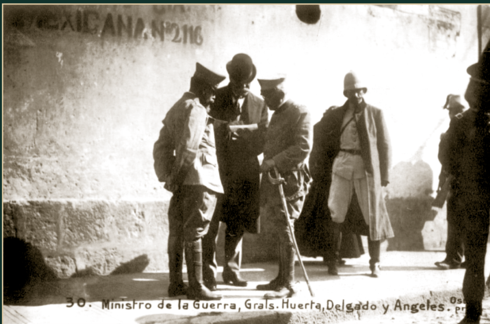
Generales Huerta, Delgado y Ángeles. 16 de febrero de 1913. Osuna. CO-AGN, Inv. 172.