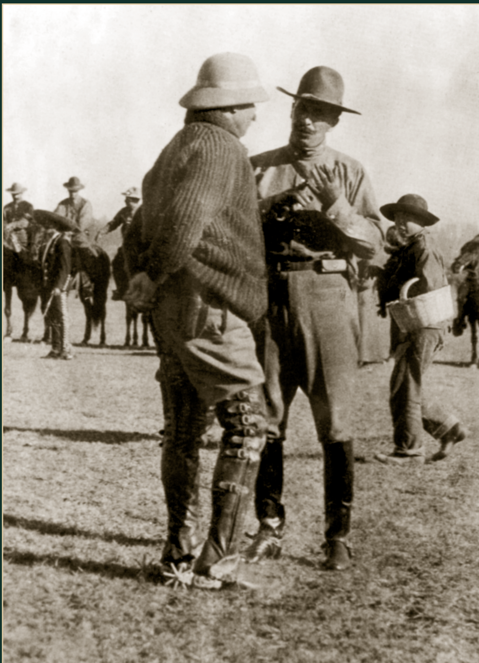
Francisco Villa y el general Felipe Ángeles. Ca. 1914.