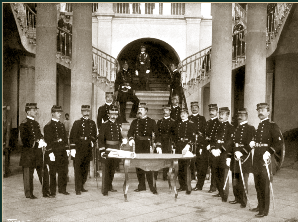
Personal militar del Colegio Militar. Ca. 1900.