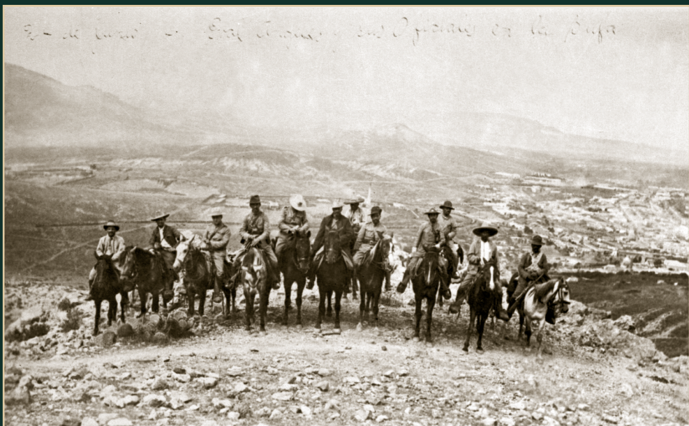
Felipe Ángeles y su Estado Mayor en el cerro de la Bufa, después de la toma de Zacatecas. Junio de 1914.