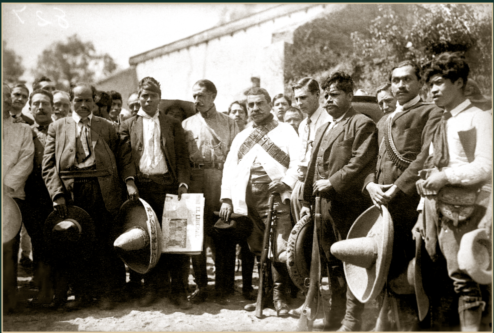
Felipe Ángeles reunido con zapatistas, retrato de grupo. Octubre de 1914.