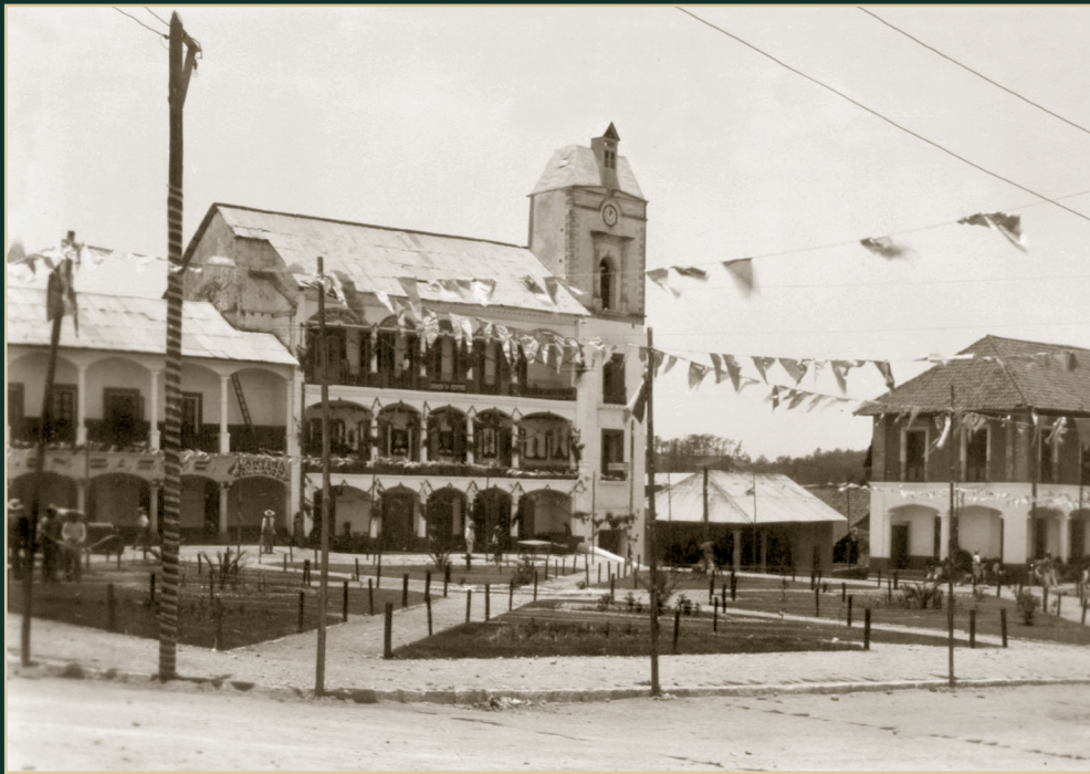
Luis Márquez, Plaza de Zacualtipán . Fotografía, Hidalgo, ca. 1920.