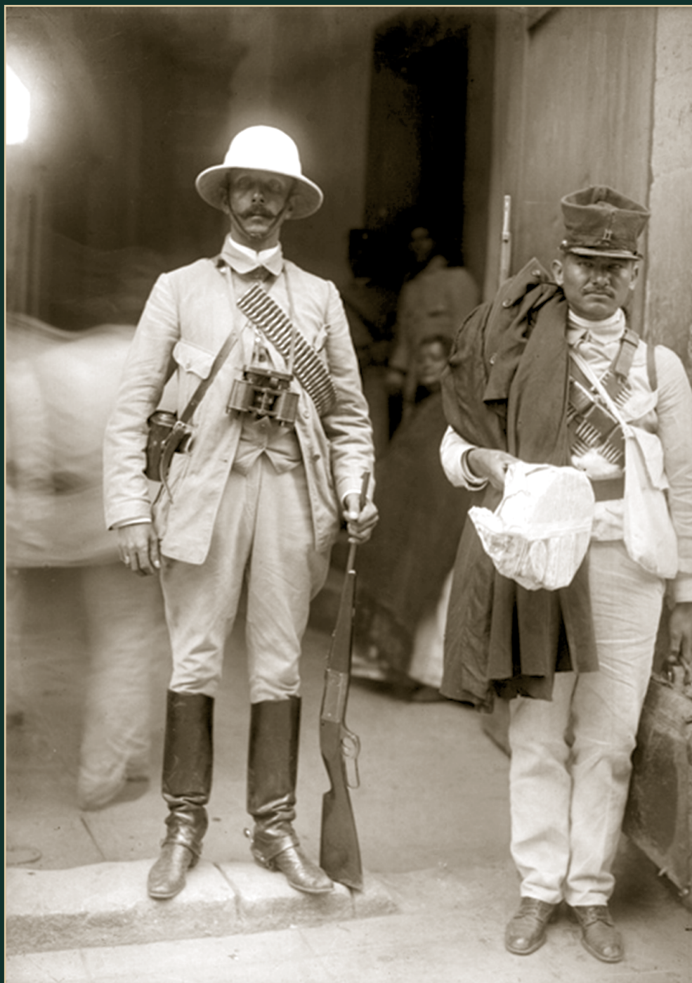
Felipe Ángeles y soldado federal a la entrada de un edificio. 1912.