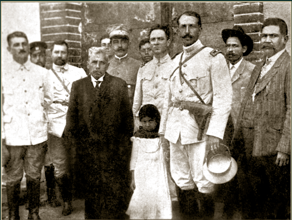
El gobernador de Morelos, licenciado Aniceto Villamar, en Yauhtepec, acompañado de los generales Felipe Ángeles y Fortino Dávila. 1912.