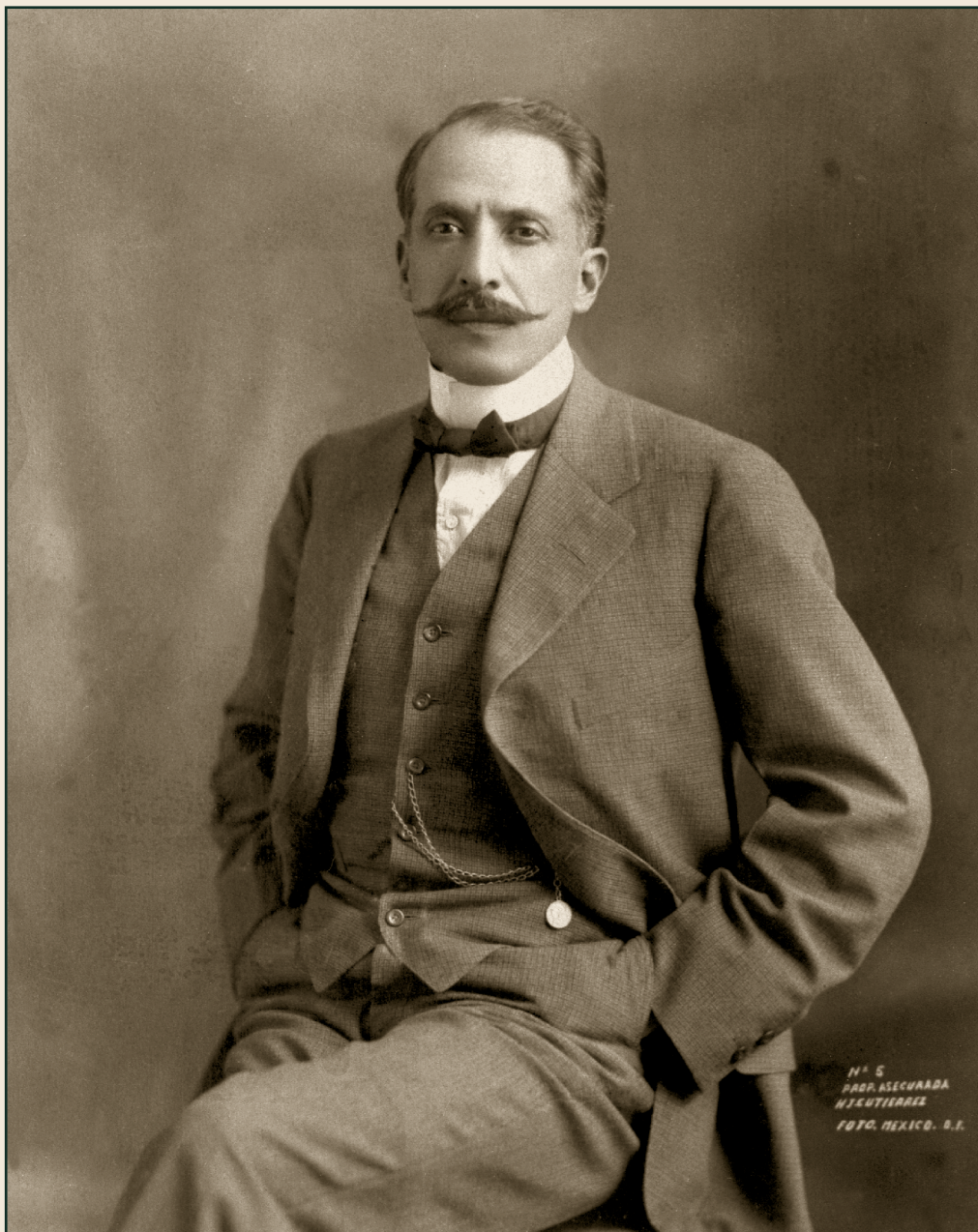
Felipe Ángeles. Fotografía, 1912.