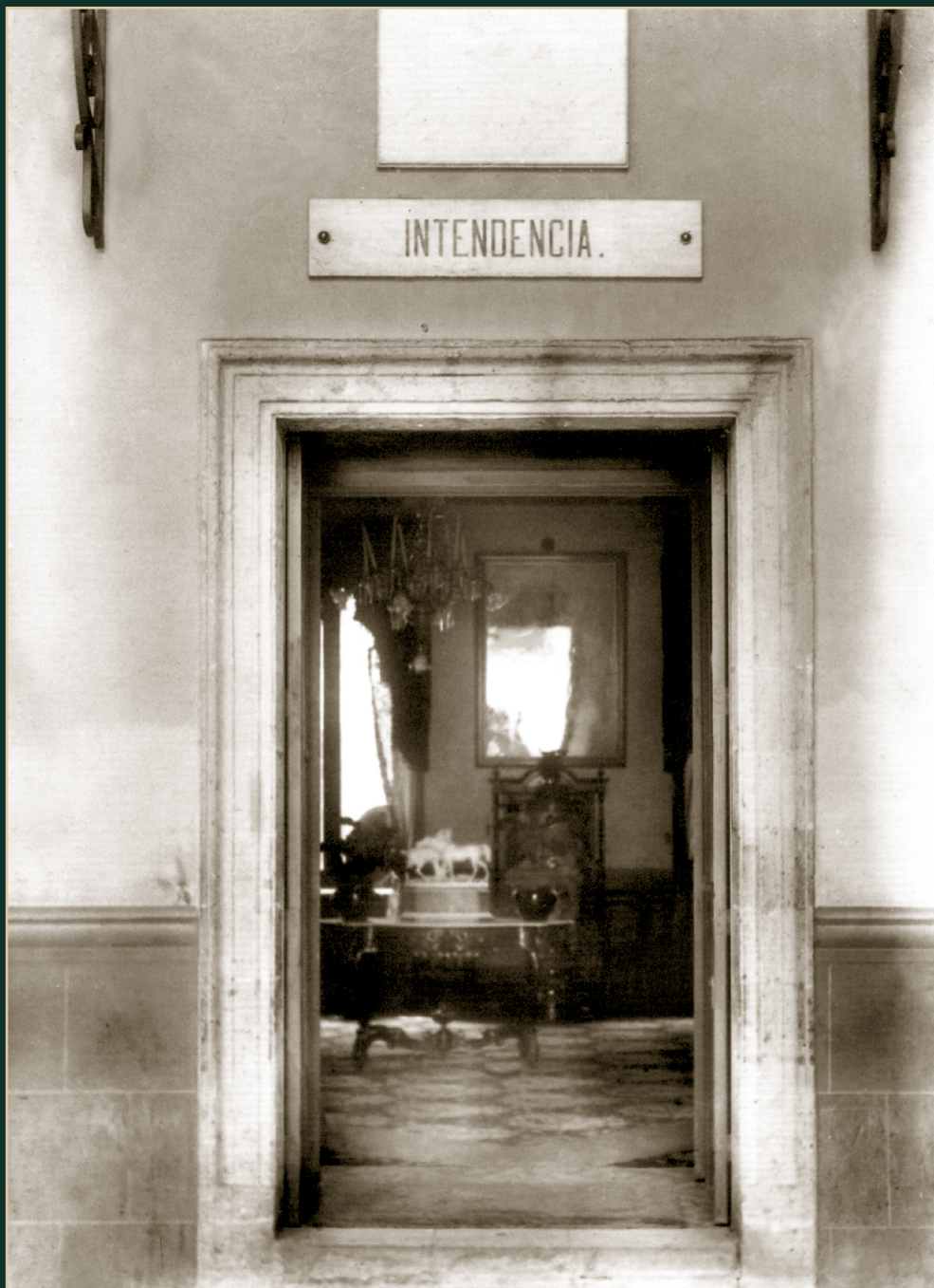
En la Intendencia del Palacio Nacional estuvieron presos Francisco I. Madero, José María Pino Suárez y Felipe Ángeles del 19 al 22 de febrero de 1913.