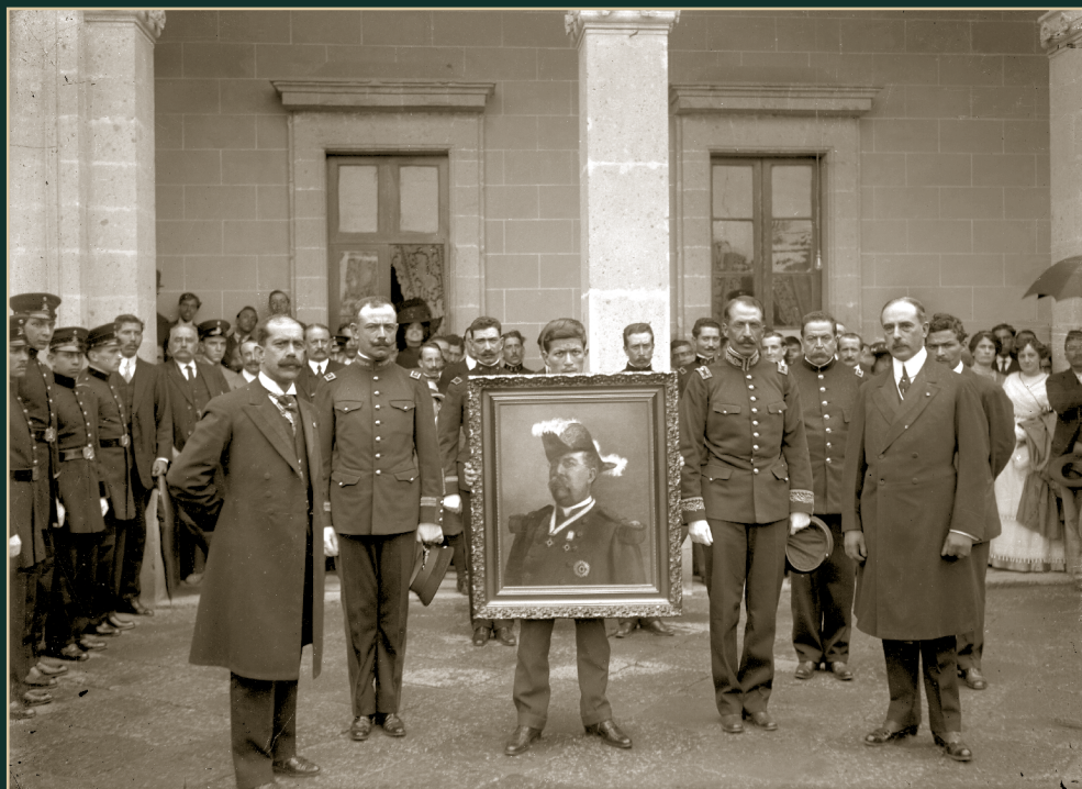
El director del H. Colegio Militar, general Felipe Ángeles, encabezando una ceremonia. 1912.