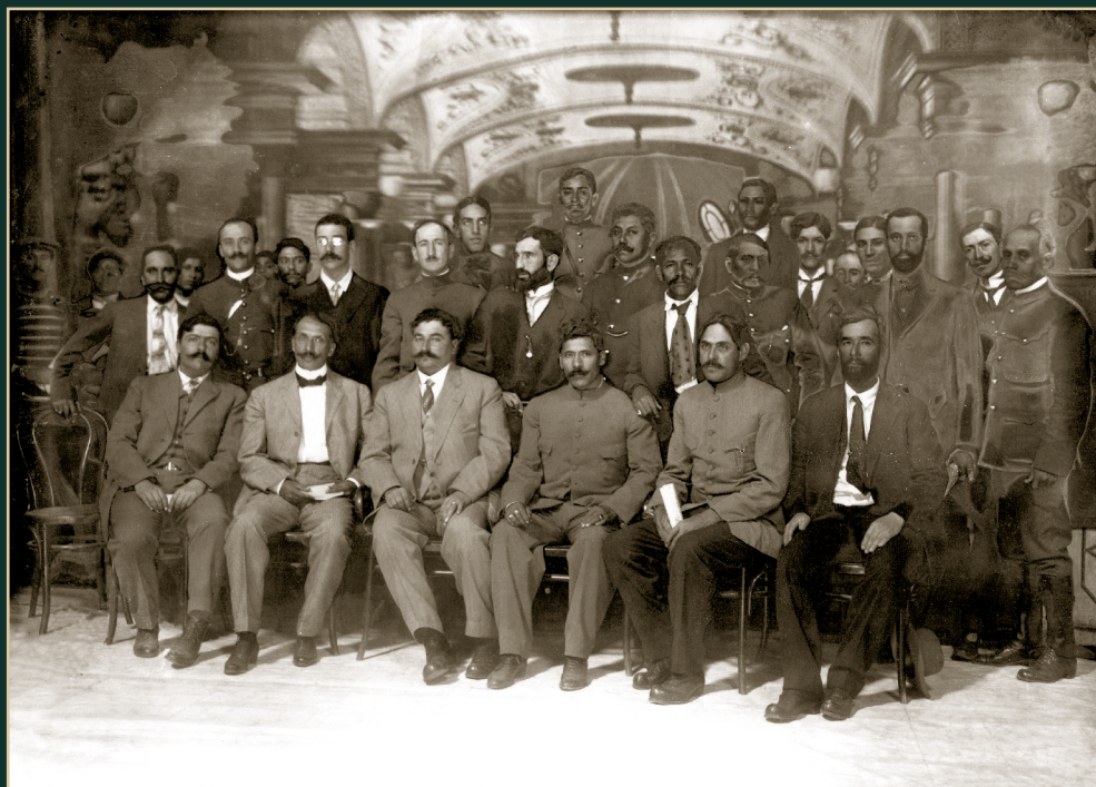
Eulalio Gutiérrez con algunos convencionistas en el Teatro Morelos, retrato de grupo. Sentados José Isabel Robles, Felipe Ángeles, Eulalio Gutiérrez. Octubre de 1914.