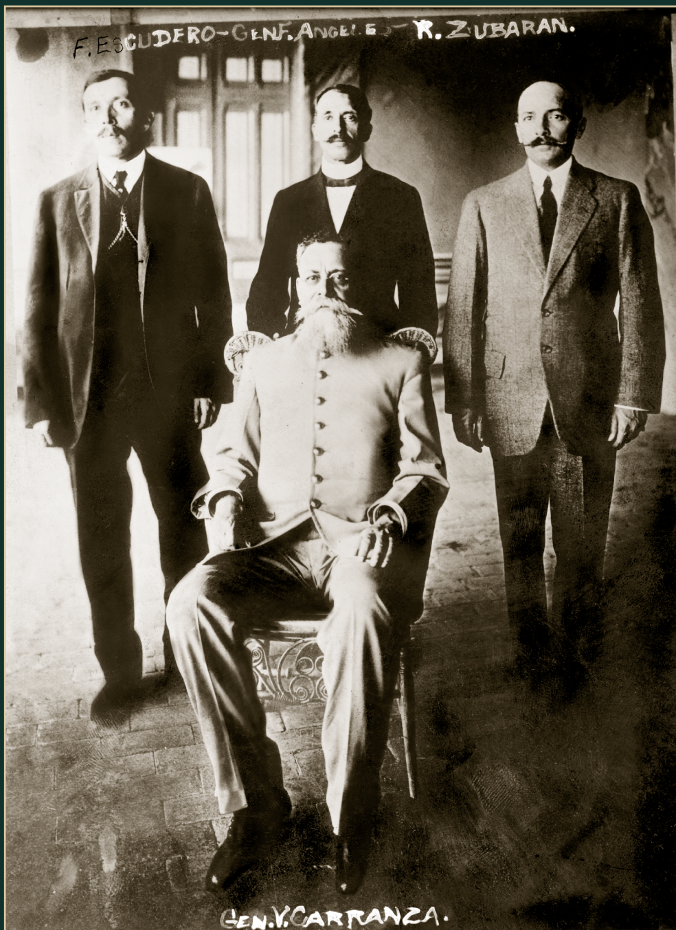
El Primer Jefe Venustiano Carranza y Francisco Escudero, general Felipe Ángeles y Rafael Zubarán Company. 1913.